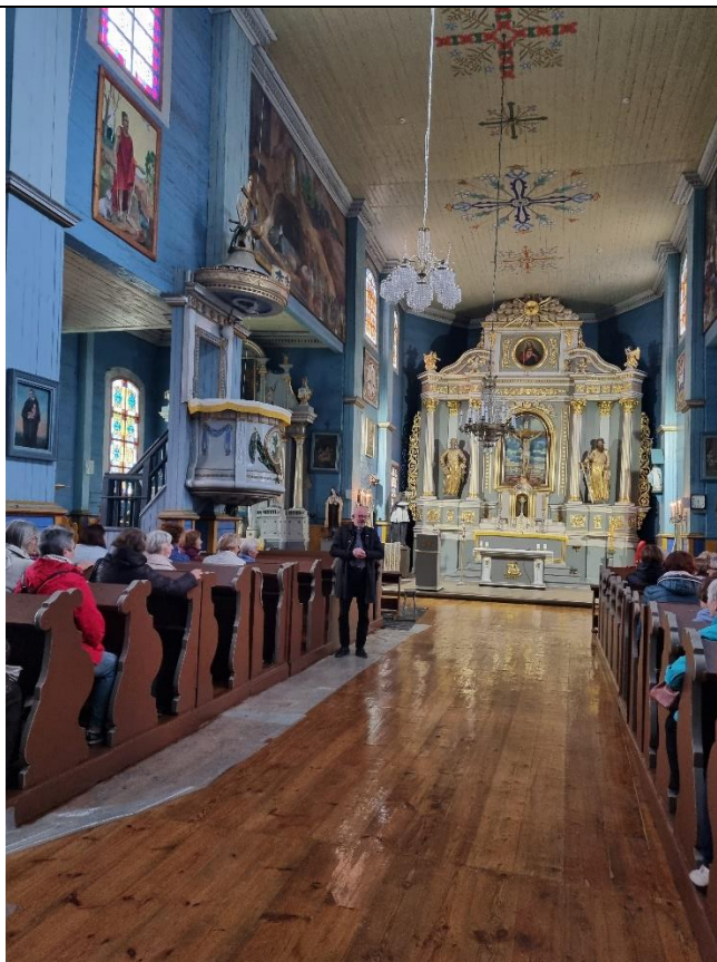
Unikalus kodas Kultūros vertybių registre – 20345