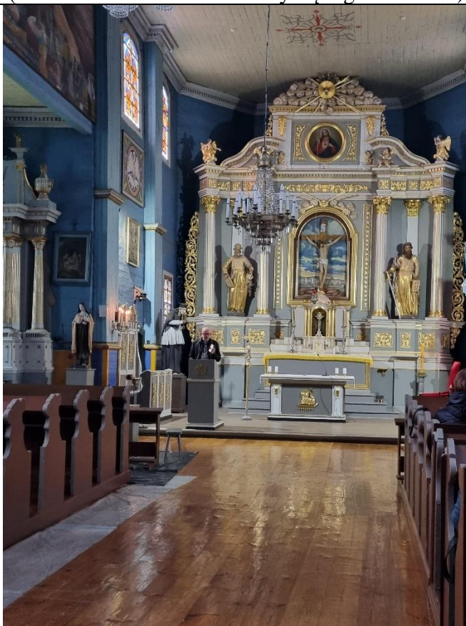
Unikalus kodas Kultūros vertybių registre – 20345